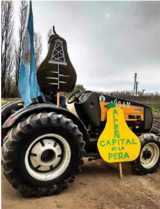
Protesta de productores en Allen, Río Negro