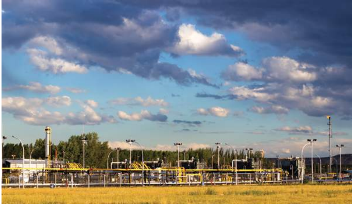
Planta de Estación Fernández Oro

del recurso de formaciones tight –por detrás de Loma La Lata-Sierra Barrosa, Río Neuquén y Rincón del Mangrullo. Comparada con proyectos de características similares –El Mangrullo, Lindero Atravesado, Rincón del Mangrullo y Río Neuquén–, la EFO es la que presenta un crecimiento más sostenido de la producción en los últimos años. Aquí, el objetivo principal de la explotación es la Fm. Lajas Inferior. En diciembre de 2018, YPF declaró la existencia de 103 pozos en extracción efectiva de tight gas . Esta cifra asciende a 161 pozos –si consideramos aquellos que se encuentran parados transitoriamente, en estudio o reparación, así como los realizados con objetivo de extraer de las Fms. Quintuco y Los Molles– y se espera que alcance los 220 en 2020. A raíz del crecimiento de la producción, en 2017 y 2018, YPF aumentó su capacidad de procesamiento en la planta de clasificación, así como de compresión y transporte mediante conexiones a los gasoductos troncales.