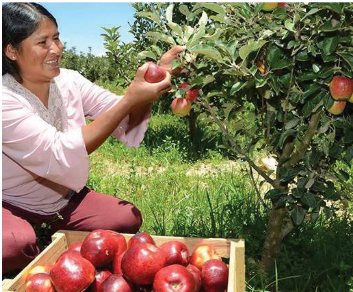
Productora en el Alto Valle

Las potencialidades productivas acumuladas en Río Negro conforman una base de excelentes condiciones para fortalecer, mejorar y transformar el sistema de producción alimentaria local. Avanzar en esta línea es una decisión política que dependerá de la apertura de una amplia agenda de debate cuyos resultados se traduzcan en políticas concretas. Es preciso que estas involucren a distintos sectores comprometidos con el objetivo de la soberanía alimentaria, en oposición a la actual concentración agroexportadora multinacional.